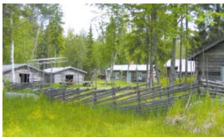
Fagerbacka fåbodställe i Purmo. Fagerbackan karjamajat Purmossa.