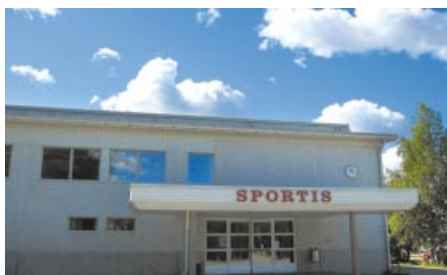
Sportis. Sportis.