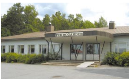
Purmogården. Purmogården.