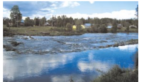
Esse å. Ähtävänjoki.