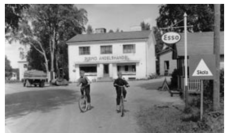
Purmo andelshandel. Purmon maalaikauppa.