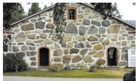
Pedersörenejdens bygdemuseum. Pedersören kotiseutumuseo.