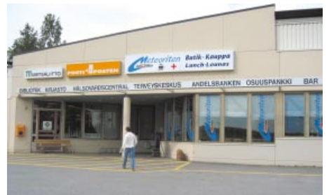
Depocenter/Meteoriten. Depocenter/Meteoriten.