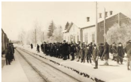
Järnvägsstationen i Bennäs. Pännäisten rautatieasema.

Finn ett framtidsminne -äänestyksen tuloksia esitellään ilman lukuja, koska äänestys suoritettiin osana kulttuurihistoriallista tutkimusta, ei tilastollista kyselyä.