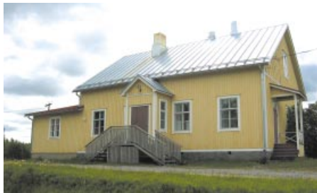
Katternö byagård. Katternön kylätalo.