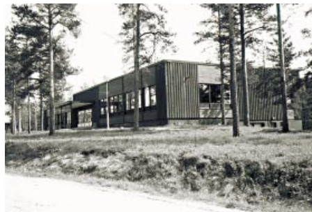
Årvasgården. Årvasgården.