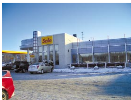
ABC, f.d. Shell. ABC-huoltoasema (ent. Shell).