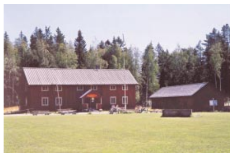
Furirbostället. Furirinpuiustelli.