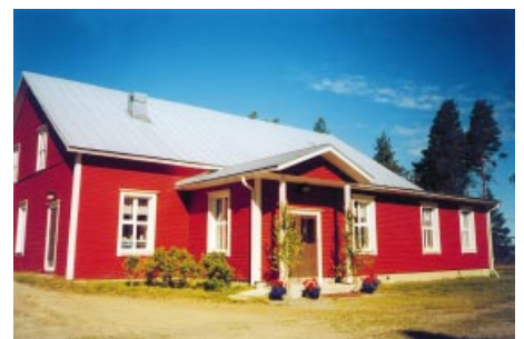
UF-lokalen i Kimo. Kimon nuorisoseuratalo.