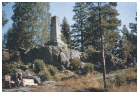
Minnesstoden över slaget vid Oravais. Foto: Oravais kommun Taistelumuistomerkki Oravaisissa. Kuva: Oravaisten kunta