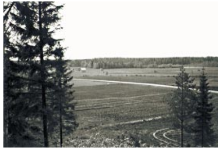
Slagfältet. Taistelutanner.

Vastauksissa mainittiin useasti myös Årvasgården ja Keskuskoulu. Finn ett framtidsminne -äänestyksen tuloksia esitellään ilman lukuja, koska äänestys suoritettiin osana kulttuurihistoriallista tutkimusta, ei tilastollista kyselyä.