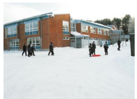
Centrumskolan. Keskuskoulu.