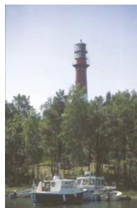
Yttergrundens fyr. Yttergrundin majakka.