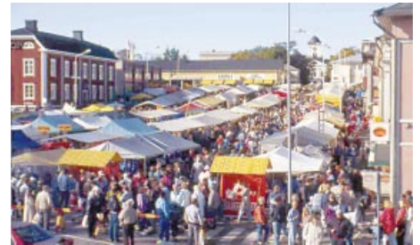
Marknad. Markkinat.