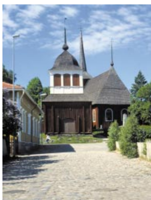
Ulrika Eleonora kyrka. Ulrika Eleonoran kirkko.