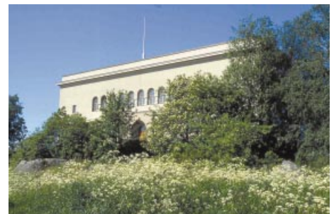
Gymnasiet, f.d. samskolan. Lukio, ent. yhteiskoulu.