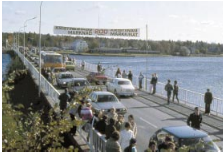
Bron över stadsfjärden. Keskustan silta.

Lebellska köpmansgården ja vanha yhteiskoulu – nykyinen Kristiinankaupungin lukio – mainitaan tietysti monissa vastauksissa. Lapväärtin kansanopisto ja mm. Skaftungin kauppa ovat myös tärkeitä framtidsminnekohteita. Finn ett framtidsminne – äänestyksen tuloksia esitellään ilman lukuja, koska äänestys suoritettiin osana kulttuurihistoriallista tutkimusta, ei tilastollista kyselyä. Luettelo heijastaa luonnollisesti osallistumisastetta eri puolilla Kristiinankaupunkia.