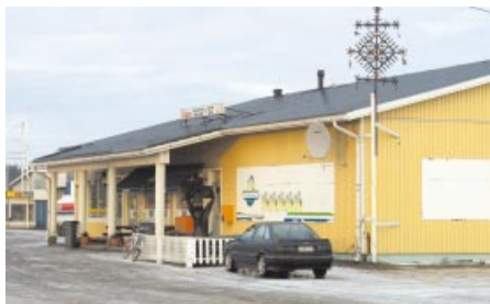
Åbro Grillcafé i Tjock. Åbron GrillikahvilaTiukassa.