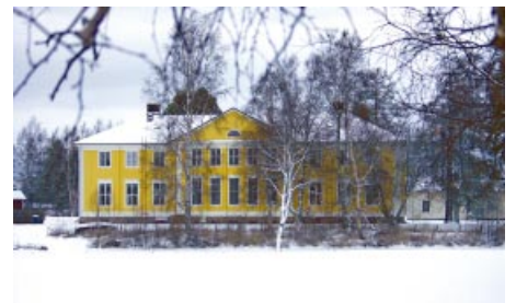
Lappfjärd folkhögskola. Lapväärtin kansanopisto.