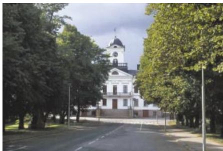
Rådhuset. Raatihuone.